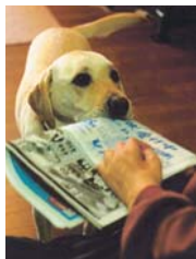
新聞を渡す介助犬

JA共済では、交通事故などにより手足に障がいのある方の日常生活をお手伝いする「介助犬」の育成・普及支援に取り組んでいます。介助犬の受け入れに対する理解を促進するための活動を通じ、障がいのある方の自立と社会参加を支援しています。